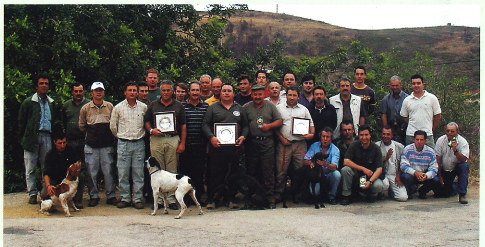
Os participantes no Campeonato Regional de Santo Huberto, juizes e directores da Federação de Caçadores do Algarve